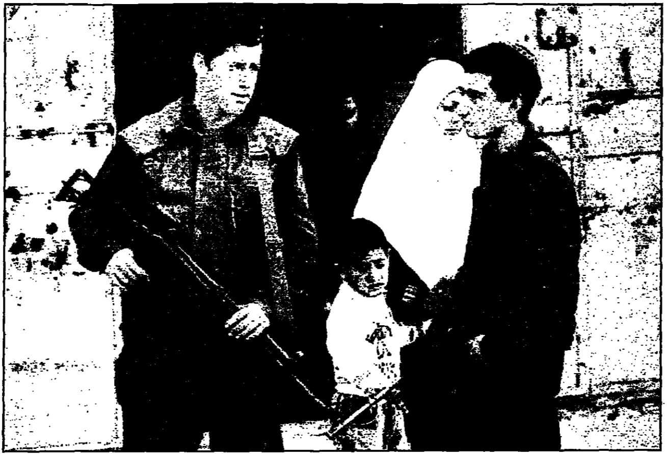
جندي إسرائيلي ومستوطن يهودي يسلمون برصاصين فلسطينيين تقود ابنتها في أحد شوارع الجزء المحتل من مدينة الخليل

القسم الثالث من مفاوضات السلام بين إسرائيل وفلسطين، التي بدأت في أيلول 1995، تواجه تحديات جديدة. رئيس الوفد الإسرائيلي المفاوض، إسحاق موريش، أعلن استقالته من الوفد الإسرائيلي المفاوض، احتجاجاً على عدم تقدم المفاوضات. موريش، الذي كان من المفترض أن يترأس الوفد الإسرائيلي في المفاوضات، أعلن استقالته في بيان صحفي، قائلاً: «أنا لم أوافق على خطة المفاوضات الحالية، ولا أرى أي أمل في نجاحها». موريش، الذي كان من المفترض أن يترأس الوفد الإسرائيلي في المفاوضات، أعلن استقالته في بيان صحفي، قائلاً: «أنا لم أوافق على خطة المفاوضات الحالية، ولا أرى أي أمل في نجاحها».